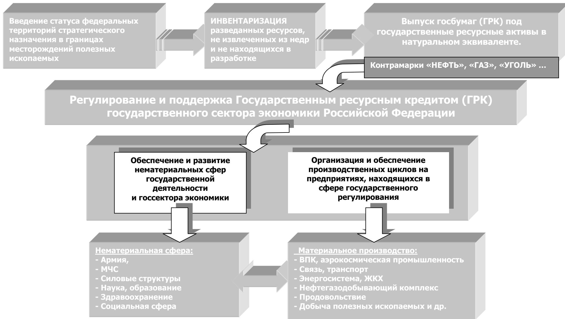
Схема 1. Механизм введения Государственного ресурсного кредита (ГРК).